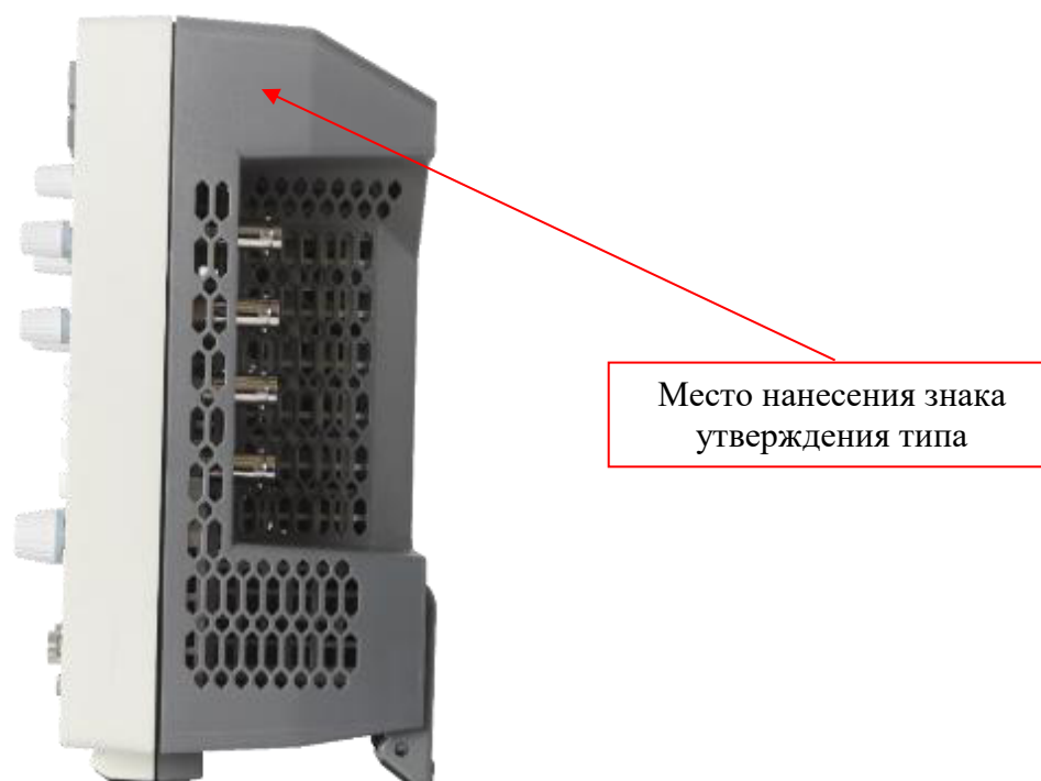
Рисунок 4 – Боковая панель осциллографов RIGOL DHO1ZZZ